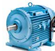
17 (15 kW) 17B (22 kW)