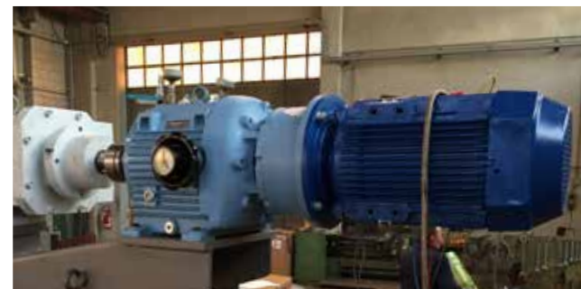
Tratamiento de residuos