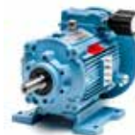
K2 (0,37-0,55-0,75 kW)