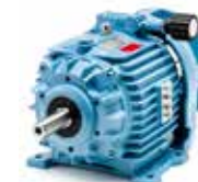
K5 (2,2-3-4 kW)