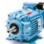
K4 (1,1-1,5 kW)